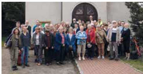
Start in Kochstedt, gut gestärkt mit einer Andacht in der Zwölfapostelkirche