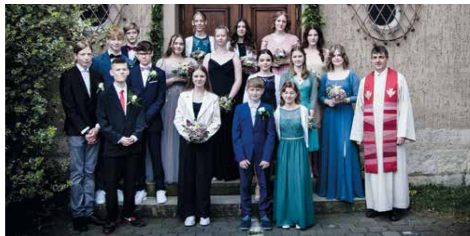
Unsere Konfirmierten des Gemeindeverbundes ACT am Pfingstsonntag 2024

Mit besten Grüßen das Vorbereitungsteam!