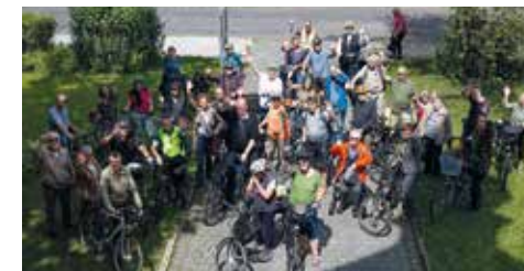
Ziel erreicht, wir sind – etwas erschöpft – an der Auferstehungskirche angekommen.